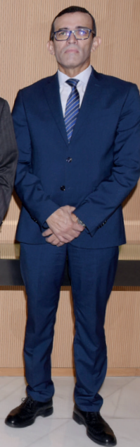
Membres du Directoire de Maroc Telecom