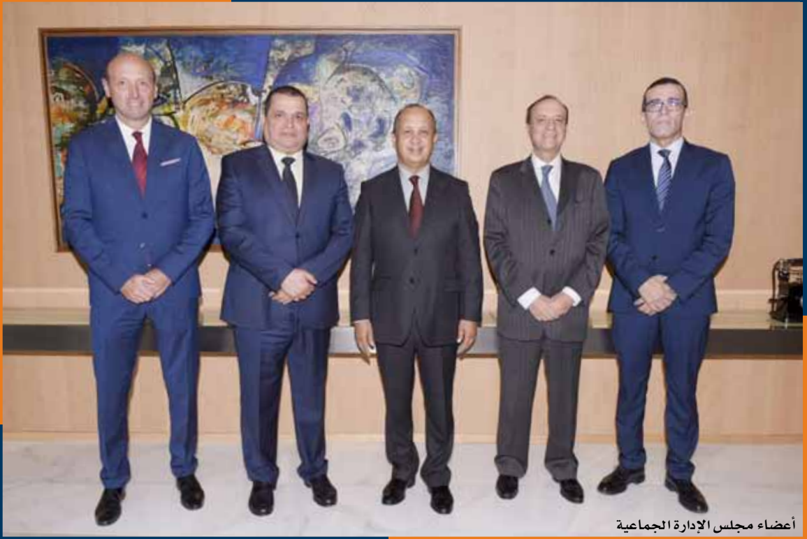
أعضاء مجلس الإدارة الجماعية